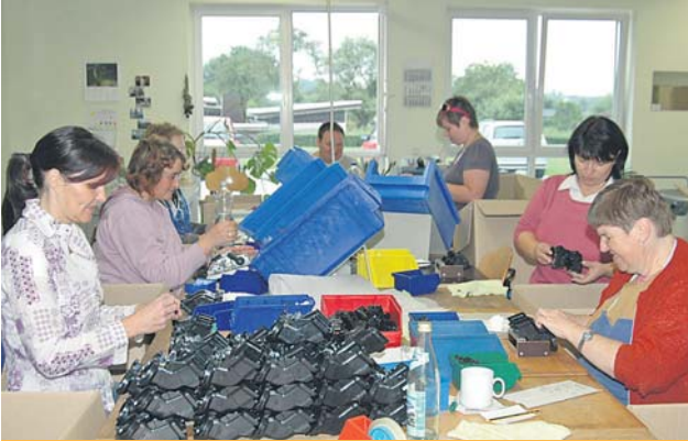
WEFA-Werkstatt in der „Mittleren Motsch“