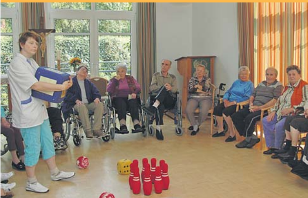
Betreutes Wohnen im Annastift in der Oberlinder Straße