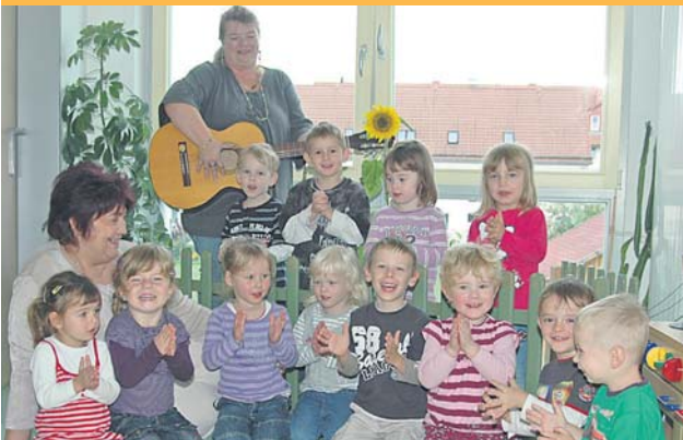
Kinder der Pinguin-Gruppe aus dem Integrativen Kindergarten „Arche Noah“ in Sonneberg-Oberlind